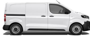
WIT (ICY WHITE)