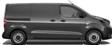
DONKERGRIJS METALLIC (GRIS TITANE)