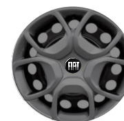
17-INCH WIELKAP FJ1 Standaard bij Exterieur pakket