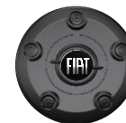
WIELNAAAFDEKKING FJ0 Standaard