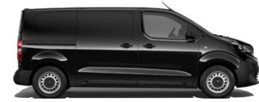
ZWART METALLIC (NOIR PERLA NERA)