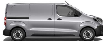
LICHTGRIJS METALLIC (GRIS ARTENSE)