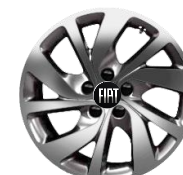
17-INCH LICHTMETAAL FJ7 € 650,00 (787)