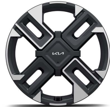
17" lichtmetalen GT-Line velgen Standaard voor GT-Line (205 / 55 R17)