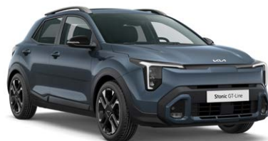
Smoke Blue Kleurcode: EU3