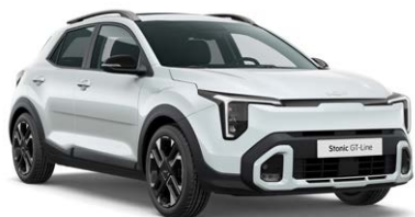
Snow White Pearl Kleurcode: SWP