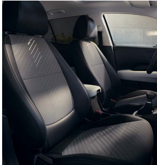
Bekleding, GT-Line, lichtgrijs stof/donkergrijs lederlook met witte stiksels

Beschikbaar voor → DynamicLine, DynamicPlusLine en ExecutiveLine