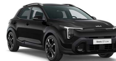
Aurora Black Pearl Kleurcode: ABP