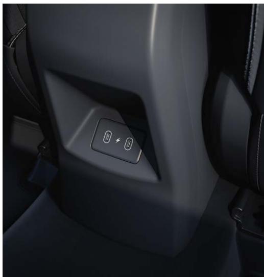
USB aansluiting(en), USB-C achter

Beschikbaar voor --> DynamicLine, DynamicPlusLine (1x USB-C) Beschikbaar voor --> ExecutiveLine en GT-Line (2x USB-C)