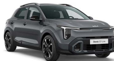
Astro Gray Kleurcode: M7G