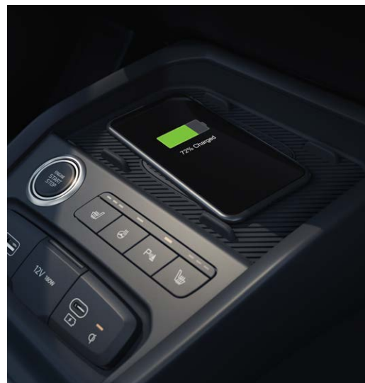
Opladstation, draadloze lader voor smartphone

Beschikbaar voor → ExecutiveLine en GT-Line