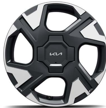
16" lichtmetalen velgen Standaard voor DynamicLine, DynamicPlusLine en ExecutiveLine (195 / 55 R16)