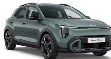
Adventurous Green Kleurcode: A2G