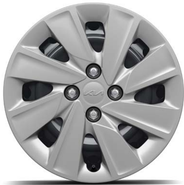
Stalen velgen, 15" met sierdeksel Standaard voor ComfortLine (185 / 65 R15)