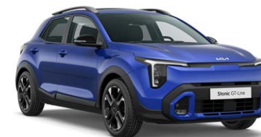
Yacht Blue Kleurcode: DU3