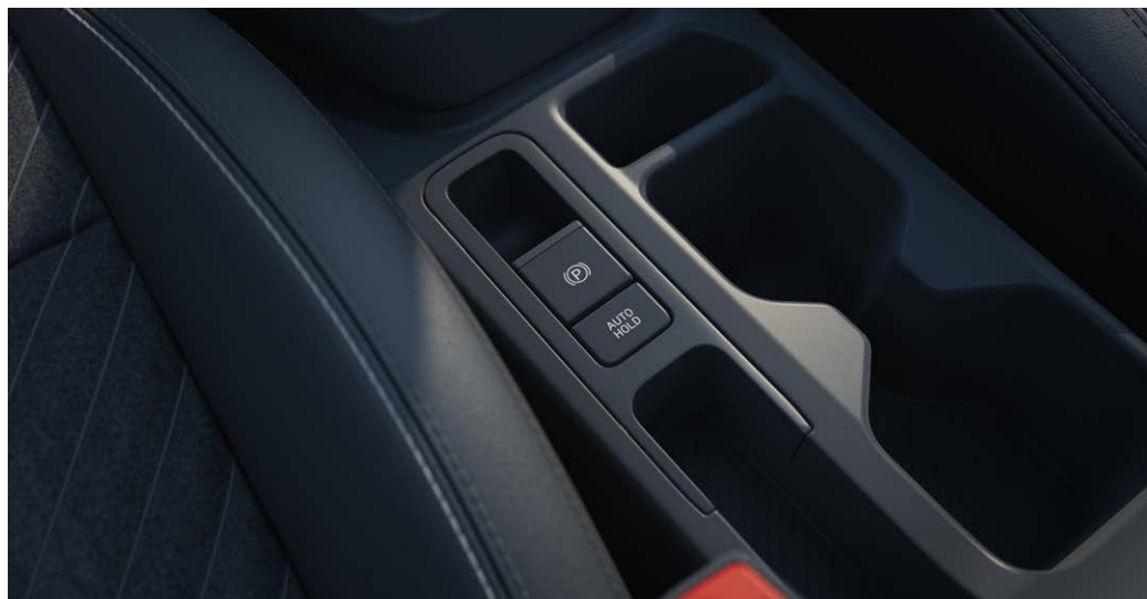
Parkeerrem, elektrisch bedienbaar met auto-hold functie

Beschikbaar voor → ExecutiveLine en GT-Line. Standaard op alle DCT-uitvoeringen.