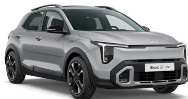
Sparkling Silver Kleurcode: KCS