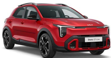
Signal Red Kleurcode: BEG