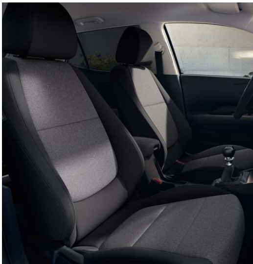
Bekleding, stof in lichtgrijs/donkergrijs