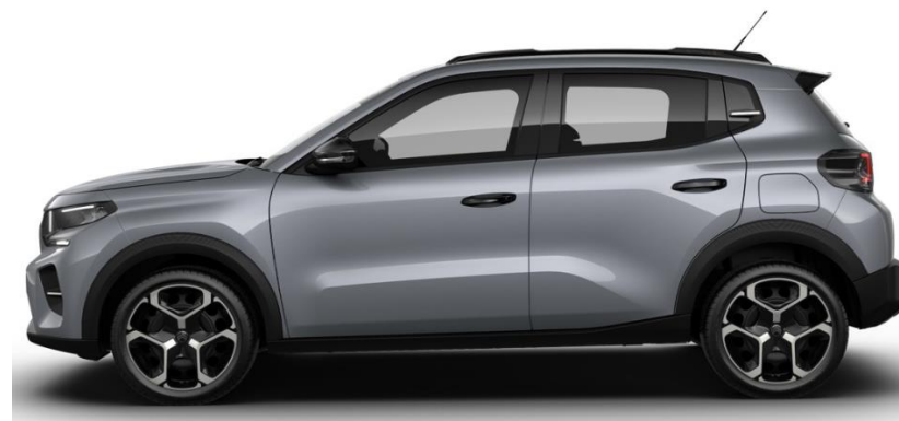
17"Stalen velgen met Wieldop 'Azurite' - standaard