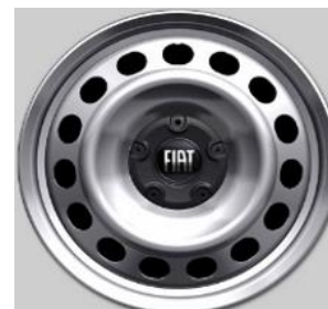
Standaard 16" Wioldoppen