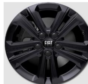
16" Lichtmetalen velgen STARLIT