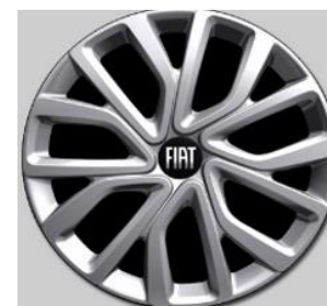
16" volwaardige wioldoppen (i.c.m. Pakket Comfort Connect Style)