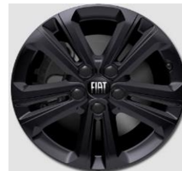
16" Lichtmetalen velgen STARLIT