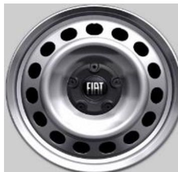
Standaard 16" Wioldoppen