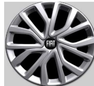
16" volwaardige wioldoppen (i.c.m. Pakket Comfort Connect Style)