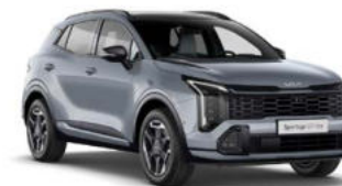
Lunar Silver Kleurcode: CSS