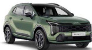
Experience Green Kleurcode: EXG