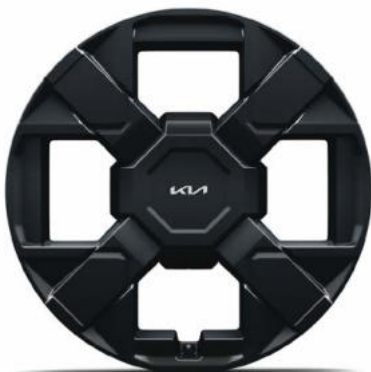
19" lichtmetalen velgen (235/50 R19 103V) Standaard op DynamicLine & DynamicPlusLine in combinatie met PHEV aandrijflijnen