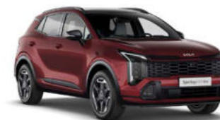
Magma Red Kleurcode: ARD