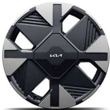
17" lichtmetalen velgen (215/65 R17 103V) Standaard voor ComfortLine uitvoeringen