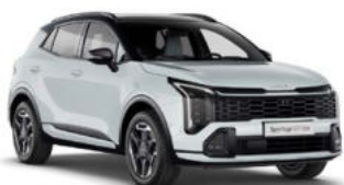
Casa White Two-Tone Kleurcode: HA3