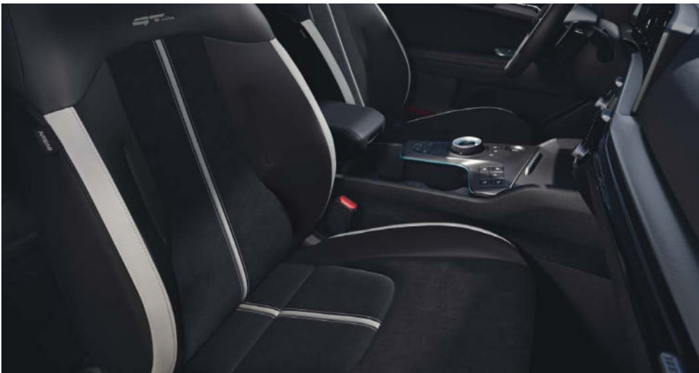
Standaard voor → GT-Line