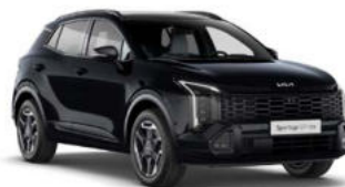
Pearl Black Kleurcode: 1K