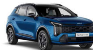
Blue Flame Two-Tone Kleurcode: HA8