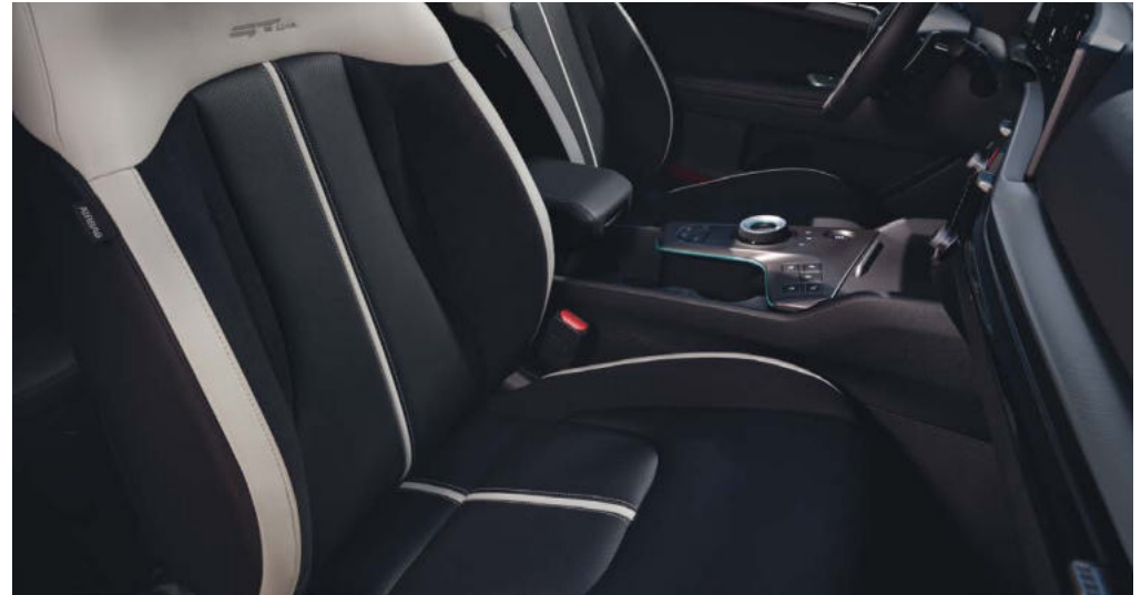
Standaard voor → GT-PlusLine uitvoeringen