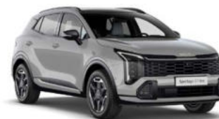
Wolf Grey Kleurcode: WAF