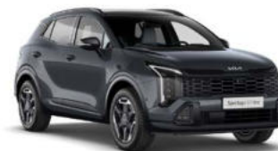
Penta Metal Kleurcode: H8G