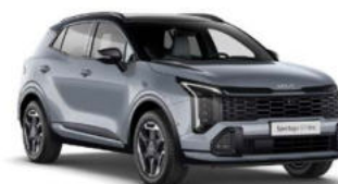
Lunar Silver Two-Tone Kleurcode: HA5