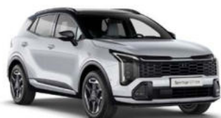
Deluxe White Two-Tone Kleurcode: HA2