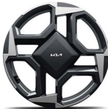
18" lichtmetalen velgen (235/55 R18 104V) Standaard voor DynamicLine & DynamicPlusLine uitvoeringen in combinatie met HEV aandrijflijn