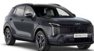
Penta Metal Two-Tone Kleurcode: HA6