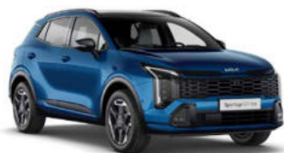
Blue Flame Kleurcode: B3L