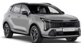
Wolf Grey Two-Tone Kleurcode: HBM