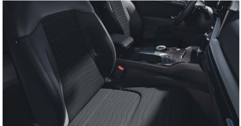
Standaard voor → DynamicLine & DynamicPlusLine uitvoeringen