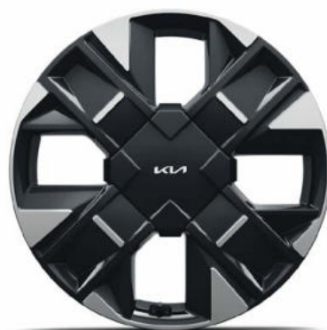
19" lichtmetalen velgen (235/50 R19 103V) Standaard op GT-Line & GT-PlusLine in combinatie met PHEV aandrijflijnen