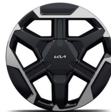
18" lichtmetalen velgen (235/55 R18 104V) Standaard voor GT-Line & GT-PlusLine uitvoeringen in combinatie met HEV aandrijflijn