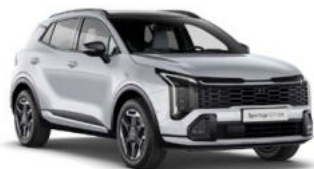
Deluxe White Kleurcode: HW2