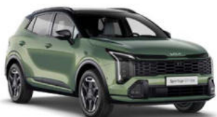
Experience Green Two-Tone Kleurcode: HBC