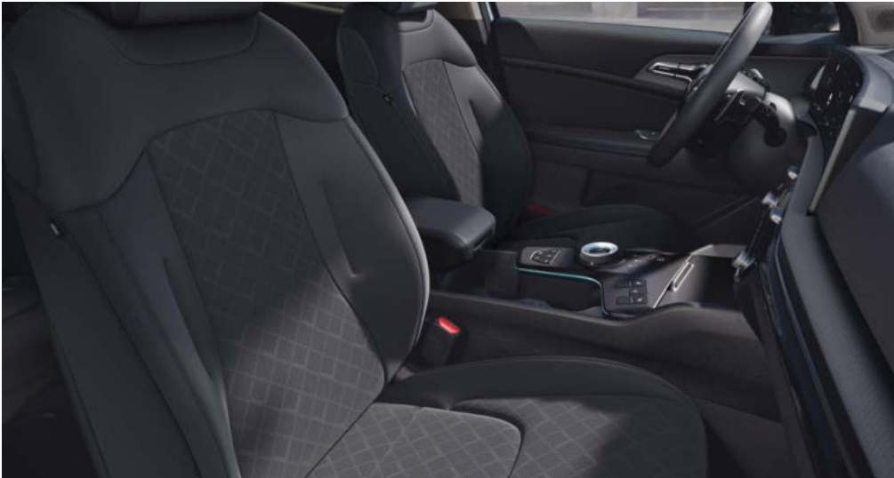
Standaard voor → ComfortLine uitvoeringen