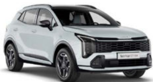
Casa White Kleurcode: WD