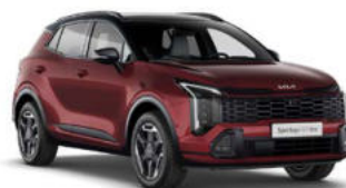
Magma Red Two-Tone Kleurcode: HBR